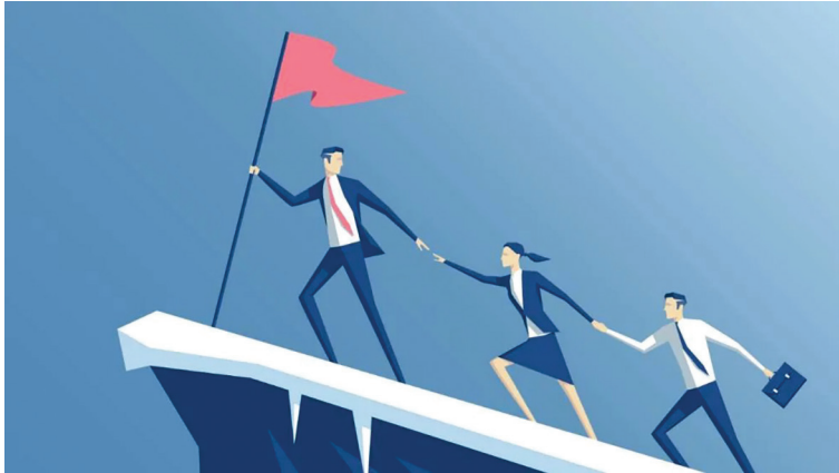
شکل ۱. رهبری یا لیدرشیپ هنر انگیزه دادن به گروهی از افراد برای اقدام در جهت دستیابی به یک هدف مشترک است

کسب‌وکاری که زیر دست او دارد فعالیت می‌کند، در بین رقبا حرفی برای گفتن داشته باشد و از صحنه رقابت عقب نماند.